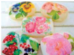
材料費が別途、必要となります。

ナブキンの絵柄を利用し、いろいろな素材に貼り付けるだけでおしゃれで素敵な作品が仕上がります。木製品、カゴ、ガラス製品、キャンドル、石鹸など様々なものを使って作品を作ります。